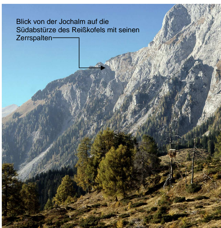
Blick von der Jochalm auf die Südabstürze des Reißkofels mit seinen Zerrspalten

Die Abrisslinie zieht südlich des Reißkofelkammes dahin.