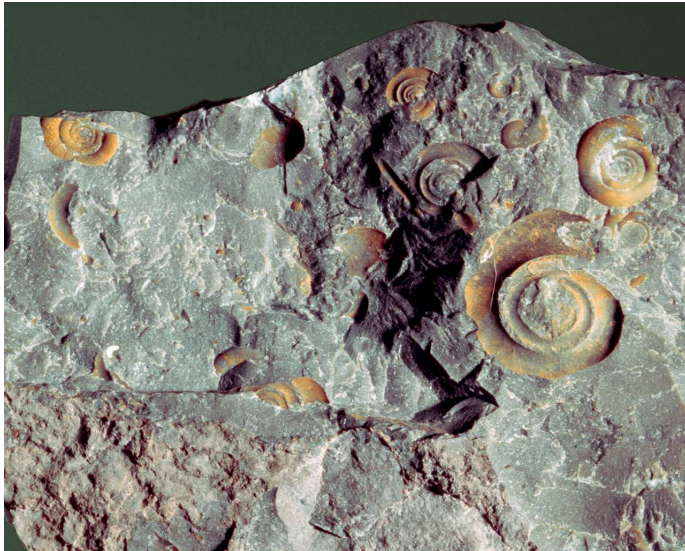
Kalkplatte mit zahlreichen Clymenien; Fundstelle: oberhalb der Promosaln.

Dieser Geopunkt liegt auf einer kleinen Verebnungsfläche, die im Westen unmittelbar an einen rund 20 m hohen Hügel aus mächtig geschichteten Kalkgesteinen angrenzt. In deren obersten Teil kommen relativ häufig Ammoniten aus dem jüngsten Devon (420-360 Millionen Jahre vor heute) vor. Sie gehören zu den Clymenien, das ist eine im Devon ausgestorbene Gruppe von Kopffüßern. Zu deren entfernten Verwandten zählt der heute im Indischen Ozean lebende Nautilus. Die spiral eingerollten Clymenien haben einen Durchmesser von 2 - 4 cm, sind also im Vergleich zu den später in der Trias und im Jura erscheinenden Gruppen als wahre Winzlinge anzusehen. Dennoch haben sie für Vergleichszwecke mit Vorkommen in anderen Gebieten der Erde eine große Bedeutung. Allein in diesem Vorkommen konnten in den letzten Jahren über 20 verschiedene Arten gefunden werden.