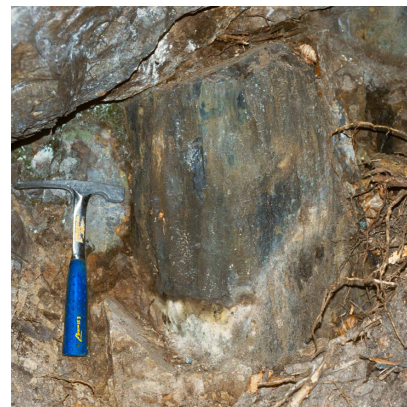
Die versteinerten Bäume von Laas