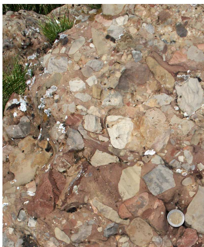
Muschelkalk-Konglomerat vom Gipfel der Kammleiten

Diese Tuffe könnten ein Hinweis auf die Entstehung durch ein Erdbeben oder einen Vulkanausbruch sein, der den Meeresboden erschütterte und dabei Teile des Untergrundes über die Umgebung hob. So könnte sich am Fuß der Hochscholle eckiger Gesteinsschutt angesammelt haben, der in Küstennähe umgelagert, transportiert, zerkleinert und zugerundet wurde. Die Verfestigung zu einem Konglomerat erfolgte durch die Auflast der überlagernden Gesteine.