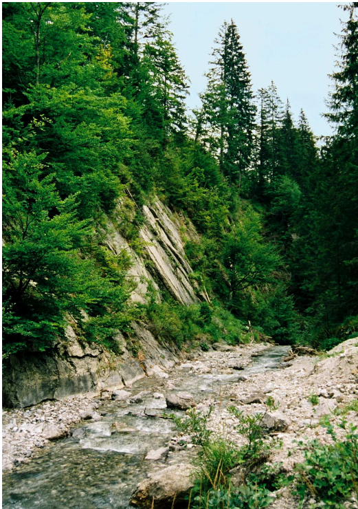
Plattenkalke aus der Trias-Zeit (ca. 250-210 Millionen Jahre vor heute) am linken Ufer

Der Gösseringgraben lädt jeden Naturliebhaber zu einer Wanderung ein, zumal nur ein sehr geringes Gefälle zu überwinden ist. Das gemächlich dahin fließende Gewässer verläuft etwa an der Grenze zwischen den Partnach-Plattenkalken und den darüber folgenden Kalken der Raibler Schichten. Somit ist hier wie bei vielen anderen Bachläufen eine Gesteinsgrenze mit einer größeren Klüftigkeit und einem geringeren Widerstand der Wegbereiter für das fließende Wasser. Die Gössering hat ein beträchtliches Einzugsgebiet mit vielen Zuflüssen, so dass das scheinbar sanfte Fließgewässer nach intensiven Regenfällen zu einem reißenden Wildbach anschwellen kann.