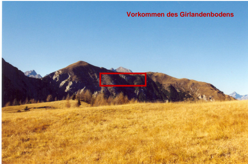
Vorkommen des Girlandenbodens

Entgegen der Natur von Böden, deren Formenreichtum und auch Ästhetik einer kleinen mit Böden arbeitenden Minderheit vorbehalten ist, gewähren Frostmusterböden, zu denen der auf der Mussen vorkommende Girlandenboden gehört, aufgrund ihrer markanten Oberflächenstrukturen auch dem Laien einen Einblick in die Welt der Böden. Leider wird dieser Zugang durch die Tatsache erschwert,