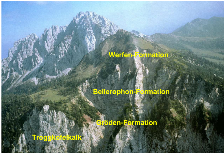
Blick auf die Reppwand; im Hintergrund der Gartnerkofel

Der Fuß der 640 m mächtigen Felswand beginnt in einer Höhe von rund 1.360 m und endet am Gipfel der Kammlaiten auf 1.998 m. Die gesamte Wand lässt sich in geologisch klar unterscheidbare Abschnitte gliedern. So besteht der Wandfuß aus grauen gebankten Kalken, die dem