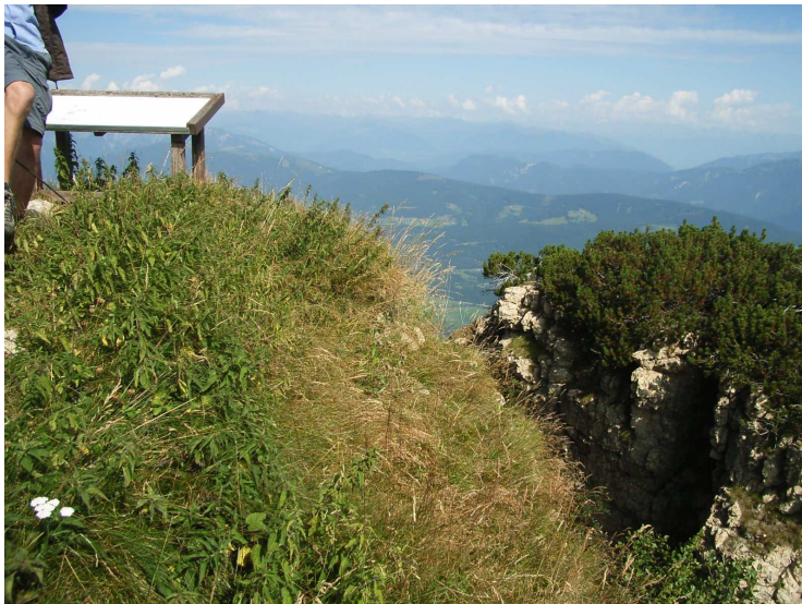
Zerrspalte am Kammleitengipfel

Der Kammleitengipfel und die Reppwand geben ein gutes Beispiel für Bergzerreibungen. Die Niederschläge und ihre zerstörerischen Kräfte wirken zuallererst auf die obersten Gesteinspartien ein. Hier kommt es, je nach Festigkeit des Gesteins, zu mehr oder weniger intensiver Verwitterung. Durch die Wirkung der Schwerkraft reißen Klüfte auf, brechen größere Gesteinspakete auseinander und beginnen im Schichtverband talwärts zu kriechen oder abzusacken, um sich schließlich in Einzelblöcke aufzulösen. Die Phänomene von Bergzerreibung, und Bodenkriechen sind am Naßfeld seit langem bekannte Phänomene. Ein Beispiel ist die Großhanggleitung unter der Reppwand, die bis zum Oselitzenbach reicht. Durch ingenieurgeologische Maßnahmen wird seit Jahren versucht, diese in den Griff zu bekommen. Das Eindringen von Wasser, Spaltenfrost, Gleitfähigkeit und Schwerkraft werden auch weiterhin die Hauptfeinde der Reppwand sein.